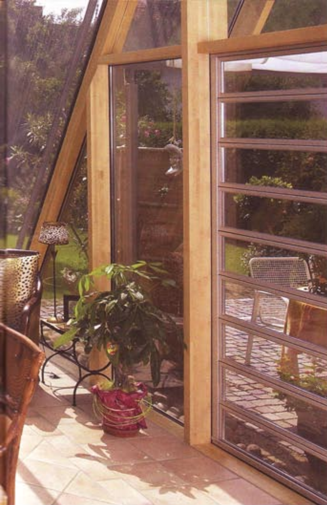
Dem Grün so nah: Der abgeschrägte Wintergarten weist direkt in den Garten.

Zur Belüftung wird Zuluft von Außen mit einem ausgeklügelten System durch das Erdreich ins Innere des Wintergartens geführt. Die so genannte Unterflurlüftung saugt die Luft von außen an und führt sie in das Innere. Sowohl außen als auch innen werden die Luftklappen durch ein Gitter abgedeckt und stören somit nicht die transparente Ausführung der gläsernen Fassade.